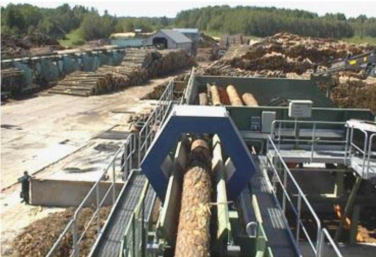
Suojattu kuusiokela DH80W

Kelojen rakenteet, mitat ja metallittomat suoja-alueet sekä nimellisherkkyydet selviävät erillisistä esitteistä.