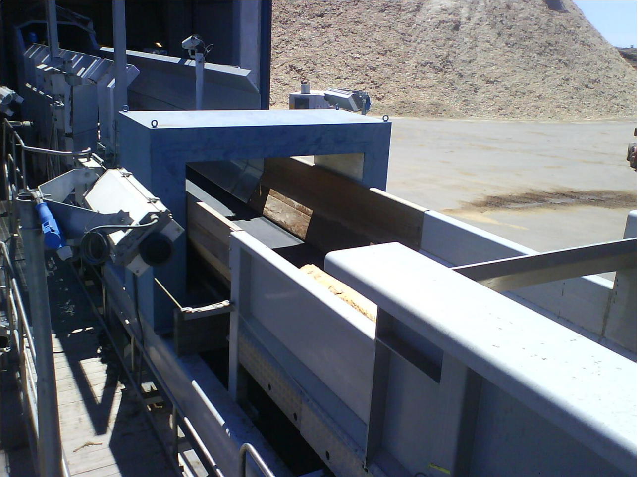
Suojattu aukkokela DQ180120 ennen hakkuria